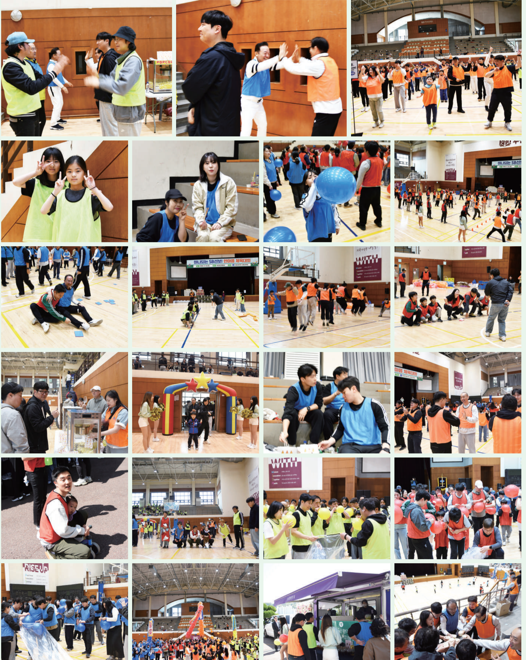
“그러나 오월은 무엇보다도 신록의 달이다.”

뜨거운 함성과 결연한 의지, 그리고 선보Family의 환한 웃음꽃이 어우러져 눈부신 봄의 정점을 완성했다. 서로 밀어주고 끌어주며 하나가 되었던 '한마음 체육대회'의 열정적인 순간들을 만나보자.