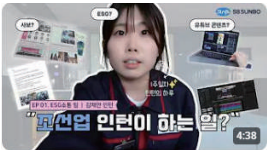
조선업 인턴 1주일 차가 하는 일? | 꾸밈없는 인턴로그 ep.1 | SB선보 조회수 362회 · 10일 전

ESG소통팀은 단순히 기업을 알리는 것에 그치지 않고 더욱 다양하고 혁신적인 콘텐츠 기획을 통해 구독자와 쌍방향으로 소통하며 SB선보의 가치를 전달하겠다는 의지다. 앞으로도 친환경 에너지 솔루션 기업으로서의 전문성과 선보인들의 열정을 담은 다채로운 콘텐츠를 선보일 예정이다.