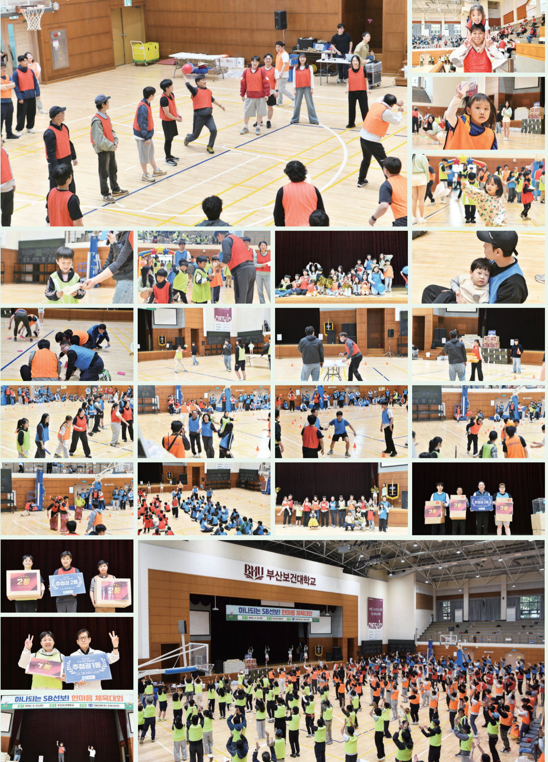
“전나무의 바늘잎도 연한 살결같이 보드랍다.”