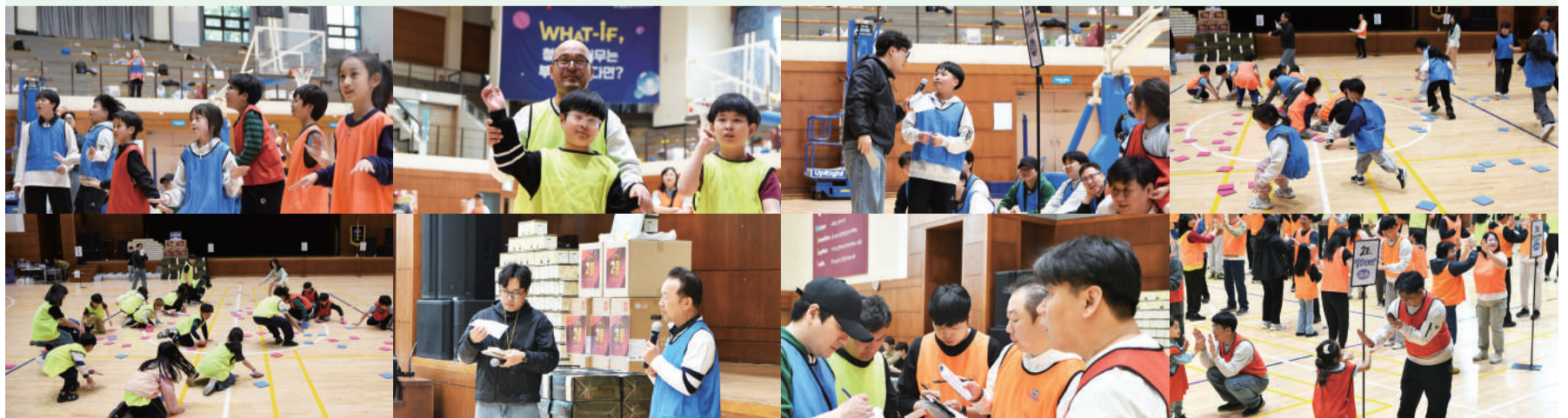
“오월은 금방 찬물로 세수를 한 스물한 살 청신한 얼굴이다.”

SB선보는 앞으로도 임직원들의 복지 증진과 건강한 기업문화 정착을 위해, 가족과 함께 소통하고 화합할 수 있는 다채로운 장을 지속적으로 마련할 계획이다.